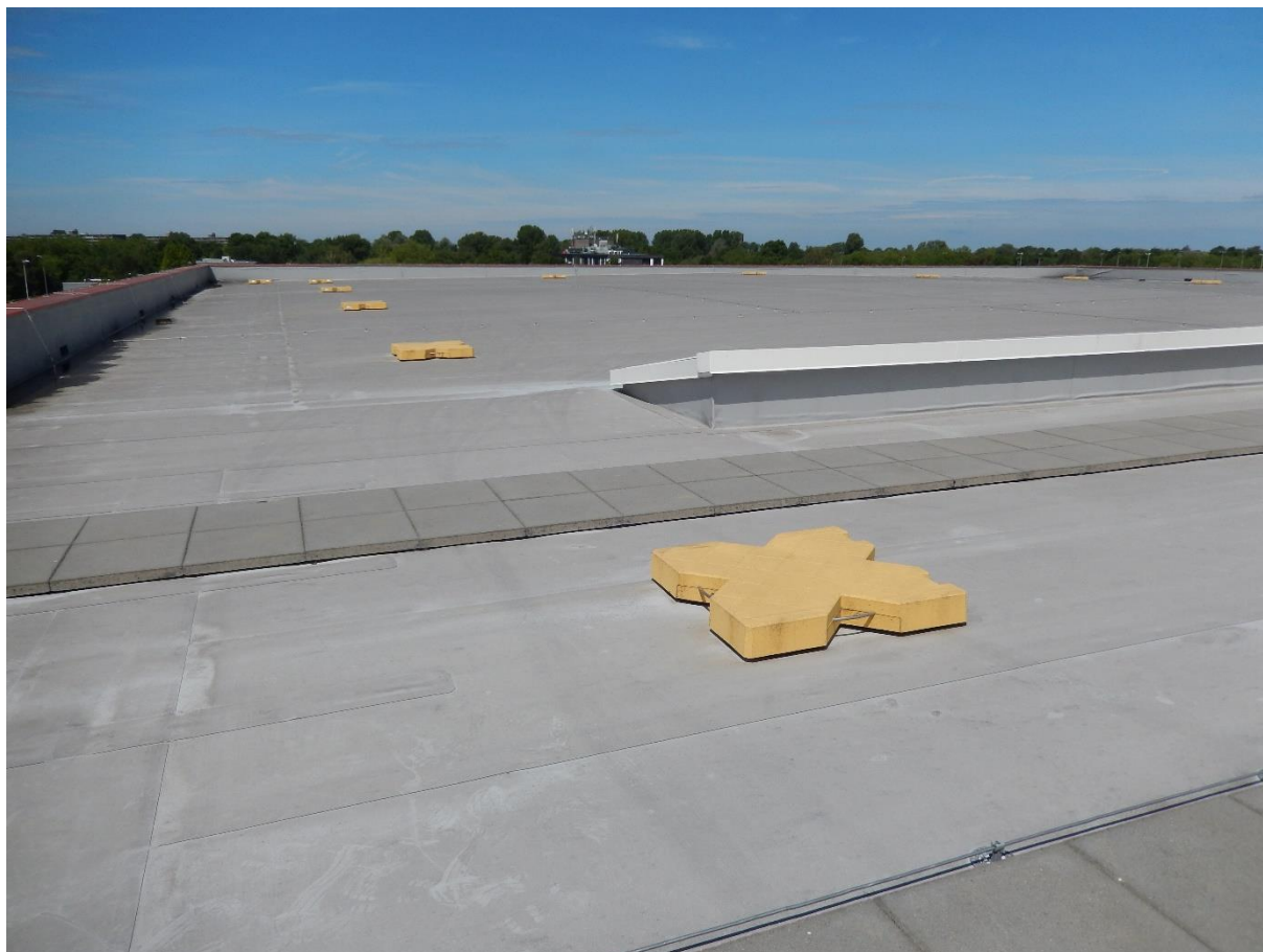
Figuur 2 – Deel van het hoge dak van sporthal De Beuk, waar de zonnepanelen komen te liggen.