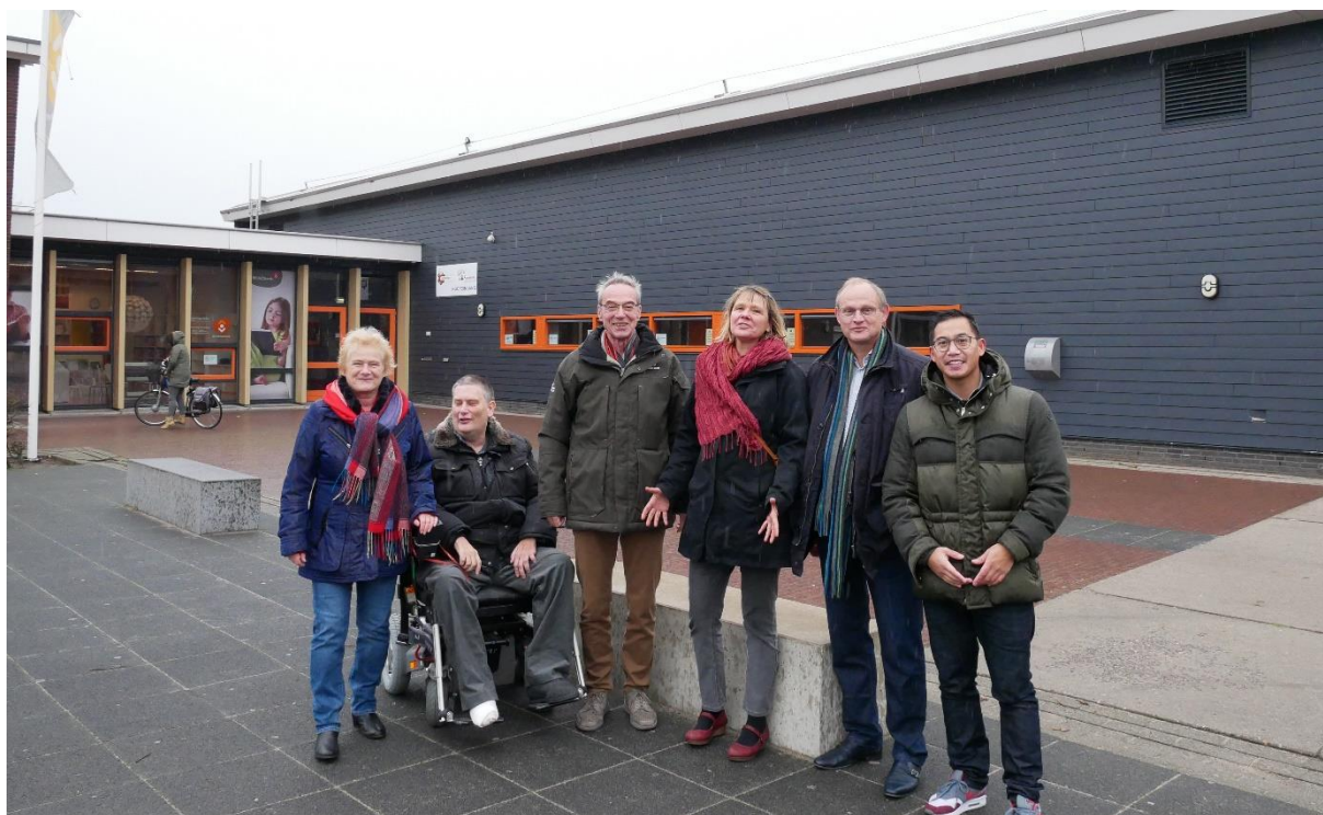
Figuur 1 – Het team van Opgewekt in Purmerend voor sporthal De Kraal in 2019

windprojecten. De Zon op Nederland formule (zie link hierboven) is een van de activiteiten binnen Energie Samen.