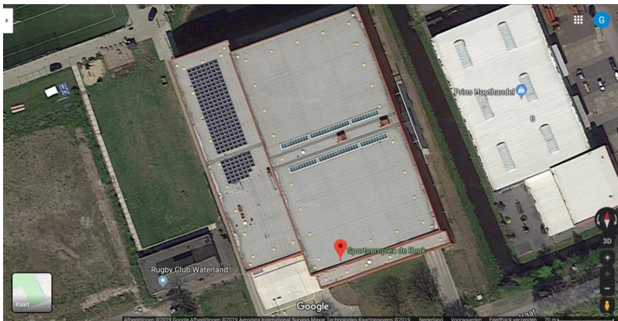
Figuur 5 - Bovenaanzicht sporthal De Beuk

De gemeente Purmerend stelt een deel van het dak van sporthal De Beuk gedurende de looptijd van de overeenkomst beschikbaar. Zon op Purmerend heeft ten behoeve van Zon op De Beuk samen met de stichting Spurd die ook zonnepanelen laat plaatsen, een constructieberekening laten opstellen waaruit blijkt, dat de draagconstructie van de locatie geschikt is voor de totale installatie van beide organisaties.